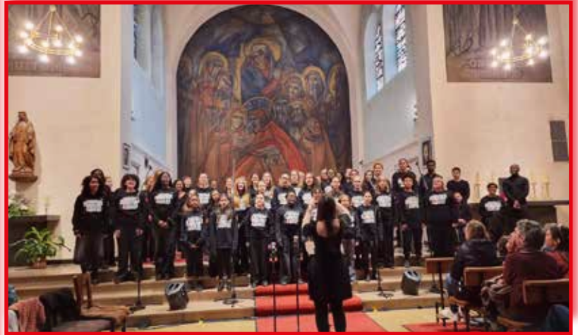
Génération Gospel Kids le 22 mars