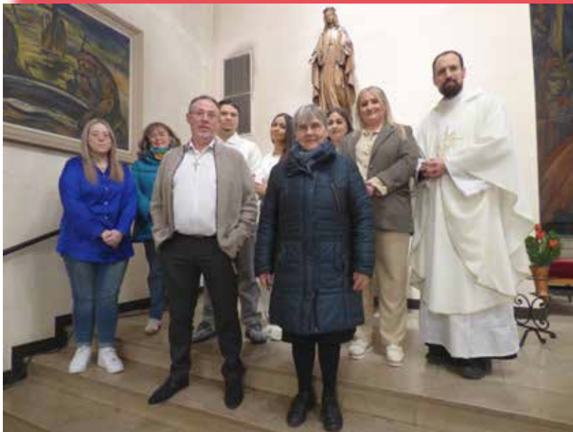
Premières communions d'adultes avec leurs accompagnateurs jeudi saint