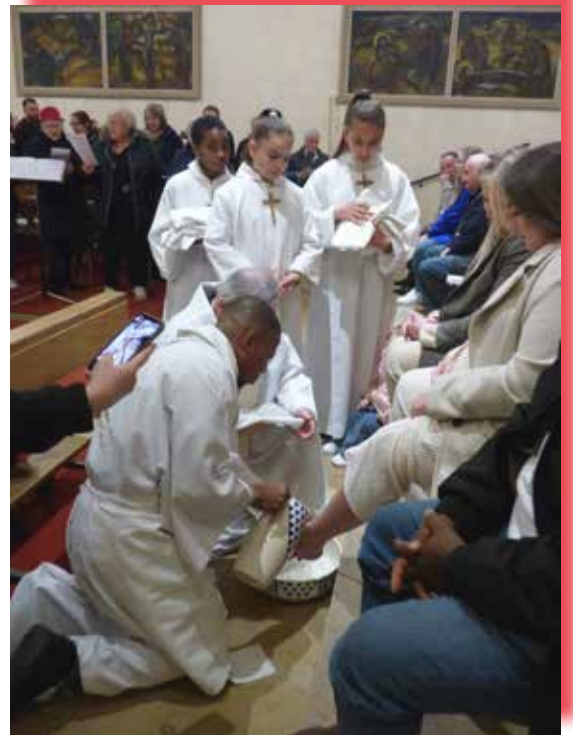
Lavage des pieds jeudi saint