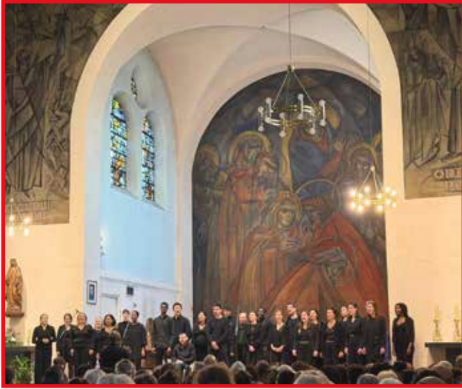
Concert des Gospel Rhymes du 22 mars