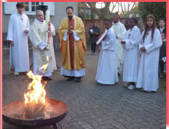
Bénédition du feu nouveau de la Vigile pascale