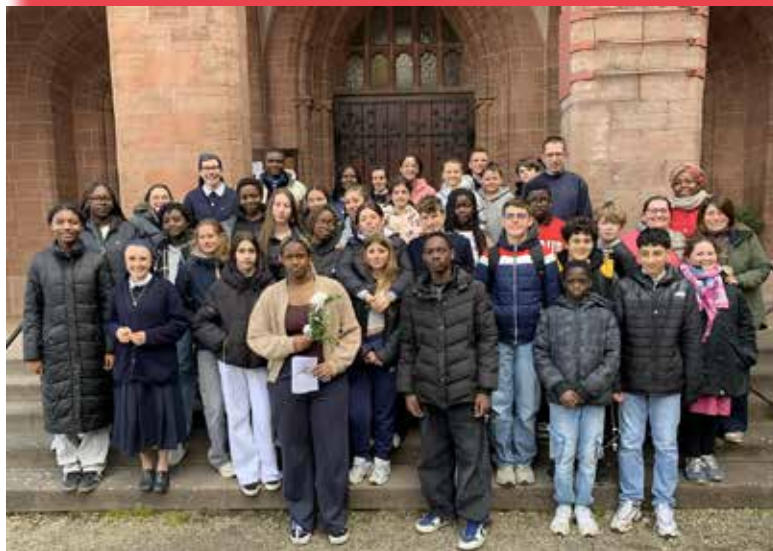
Week-end interparoissial des ados les 28-29 mars à N.D. des Neiges