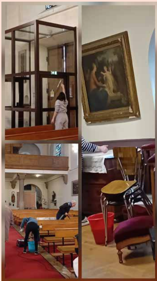
Un service parmi tant d'autres

« VOUS AVEZ REÇU GRATUITEMENT : DONNEZ GRATUITEMENT. »