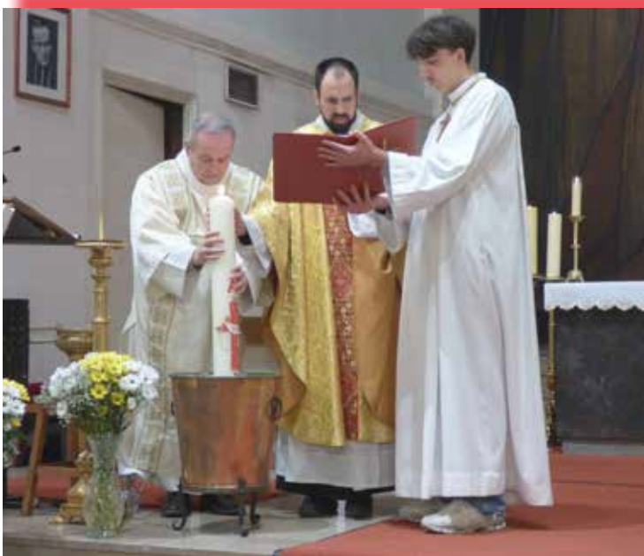
Plongée du cierge pascal dans l'eau bénite