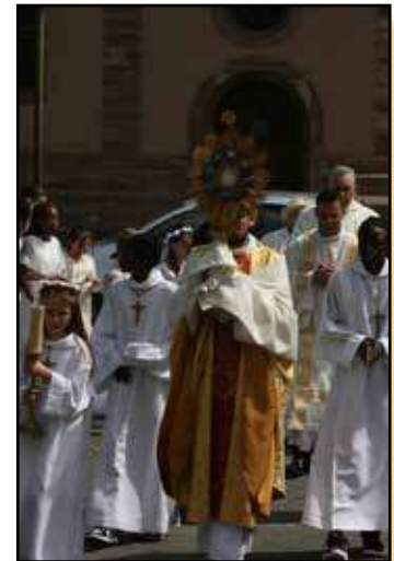
Fête - Dieu à Saint Ignace