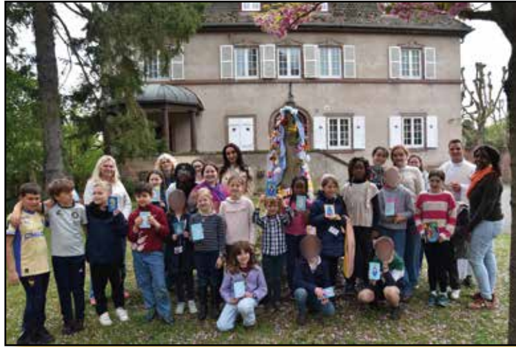
La Hutte St Ignace en avril