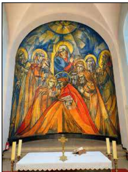
Fresque Pentecôte retouchée avec IA