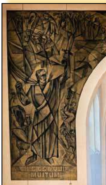
Fresque de Saint Ignace à gauche