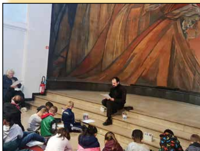
Les enfants de la catéchèse scolaire découvrent les fresques de l'église.