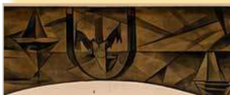
Fresque du blason de Saint Ignace