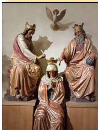
Le couronnement de la Vierge