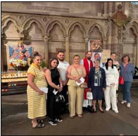
Les confirmants de la paroisse entourés de leurs accompagnateurs