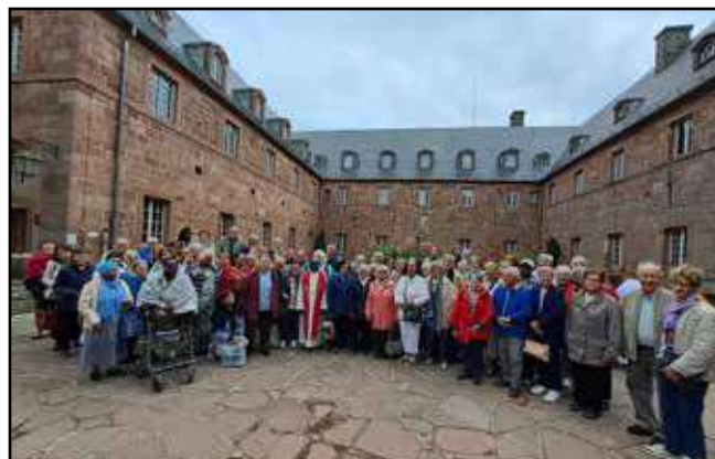
Nos paroissiens parmi les pèlerins du Doyenné au Mont Sainte Odile le 3 juin