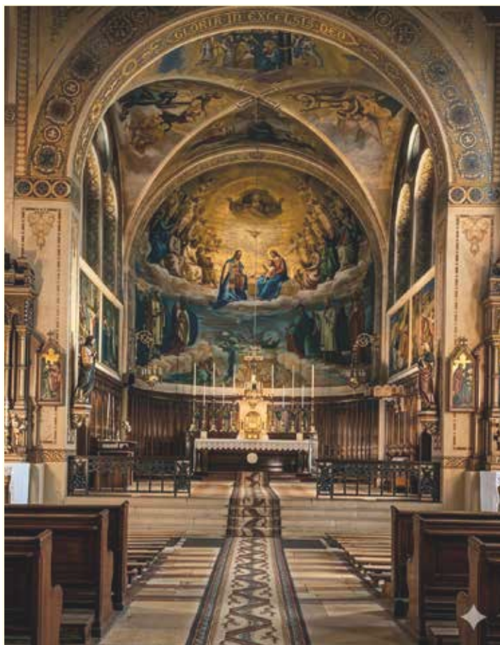
Le chœur de l'église Saint Ignace avant 1948

Depuis le 1er siècle, les chrétiens ont orné les lieux de culte pour rendre gloire à Dieu. Au 6e et au 7e siècle un conflit opposa les iconoclastes, refusant toute représentation du Christ ou des saints, aux iconodules, défenseurs du culte des images sacrées. L'empereur Théodora réunit un synode en 843 pour clôturer définitivement cette querelle. Puisque nous croyons que Jésus est Dieu fait homme, nous pouvons représenter l'humanité de Jésus sans manquer de respect à la perfection de Dieu.