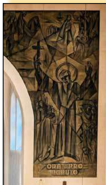
Fresque de Saint Ignace à droite retouchée avec IA